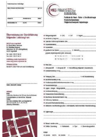
Abb. 2: Praxisformular

Diese Regelung gilt für alle gesetzlich versicherte Patienten, auch wenn primär eine Selbstzahlerleistung (z.B. Implantologie) geplant ist.